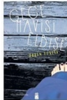
ON8 Kitap, 310 syf, 19TL