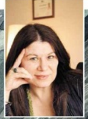
Yazarın önceki kitapları arasında, "İyi Tanrının Çocukları", "Artık Ayrılsak Diyorum", "Kuzgunun Sarkası" ve "Meltem K'yı Kim Oldurdu" sayılabilir.