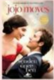
Senden Önce Ben Jojo Moyes Pegasus Yayınları

Bunu geçirdiği motosiklet kazasıyla hayatı altüst olan Will'e tanışınca anlıyor. Will ufak tefek şeylerle ya da aklınıza gelebilecek herhangi bir büyük şeyle de mutlu olacak biri değil. Keyifsiz ve anlaşılır sebeplerle çok kırıcı. Çevresindeki tüm renkler solmuş gibi geliyor ona