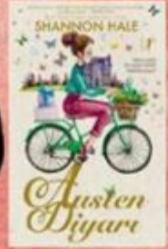
Austenland Shannon Hale Artemis Yayınları

"Yalnızım çünkü tüm şahane erkekler kitaplarda yaşıyor" diyor "Austen Diyan"ın kahramanı Jane. Adaşı Jane Austen'a hayran ve Bay Darcy'ye benzeyen bir erkeğe rastlayamadığı için hayatında kimse yok. Derken zengin bir akrabası ona mirasından küçük bir pay bırakıyor; İngiltere'de, Austen takıntılı kadınlara hizmet eden bir işletmede kısa bir tatil... Ne olacak peki; kurgusal bir "Austen Diyan"na kapanmak acaba Jane'in hayatını güzelleştirecek mi, yoksa Bay Darcy rüyası onu tamamen ele mi geçirecek? "Prens Akademisi" ve Grimm Kardeşler'in çocuklukta okuduğumuz peri masallarını "Kaz Çobanı", "Ateş Kız" gibi nefis birkaç kitabıyla tanıdığım Shannon Hale, daha sonra dizi haline de getirilen "Austen Diyan" ile Newberry Onur Ödülü'nü almış.