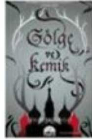
Gölge ve Kemik Leigh Bardugo Marb Yayınları

İsraili Leigh Bardugo fütüristik distopya üçlemesinde, dünyayı kurtarma potansiyeline sahip bir genç kızın maceralarını anlatıyor. Bardugo'nun 18. yüzyıl Rusya'sından esinlenerek kurduğu dünya ve atmosfer müthiş. Ayrıntılı haritalar, müthiş güzel kapak çizimleri, kubbeli saraylar, karanlık ormanlar, geleneksel Rus masallarından fırlamış dehşet verici yaratıklar, yorgun savaşçılar, yarı kahramanlar, seriye adını veren kibirli Grisha'lar, masum yüzlü iblisler, yaşlı bilge kadınlar, karların altında uzun uzun yürüdükten sonra barlarda, ateşin etrafında içilen "kvas"lar, bolca kullanılan Rusça kelimeleri, farklı ve kudretli bir şıklığı simgeleyen renk renk 'kefta'lar... Bütün bunlar "Grisha Üçlemesi"ni genç okurlar için karanlık ama sürükleyici bir aşk hikayesi haline getiriyor. İlk kitap "Gölge ve Kemik" in ardından, "Kuşatma ve Fırtına", "Çöküş ve Yükseliş" i okuyabilirsiniz. "Kargalar Meclisi" ise yazarın aynı atmosferde geçen bir diğer romanı. Grisha dünyasıyla tanışmak isteyenler için... Bu arada hikâyeyi pek yakında beyaz perde izleyeceğimizi de söyleyeyim.