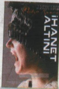
İhanet Altını Philip Reeve Çeviri: Fulya Yavuz On8 Kitap 368 sayfa